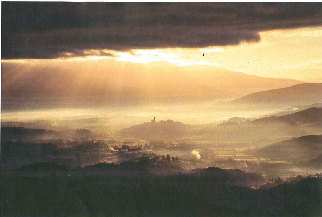
Casentino

Il GAL Appennino Aretino a fine 2020 ha approvato, nel proprio Consiglio di Amministrazione, 3 graduatorie preliminari. L'attività del GAL apre il 2021 con la verifica di ammissibilità di 58 Domande che risultano potenzialmente finanziabili grazie alle risorse disponibili di ben 2.350.000,00 di euro. Riguardano due misure rivolte al settore pubblico e una rivolta al settore privato, ma vediamo nel dettaglio: